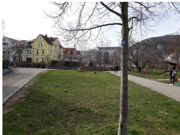
Fläche Blick nach Westen