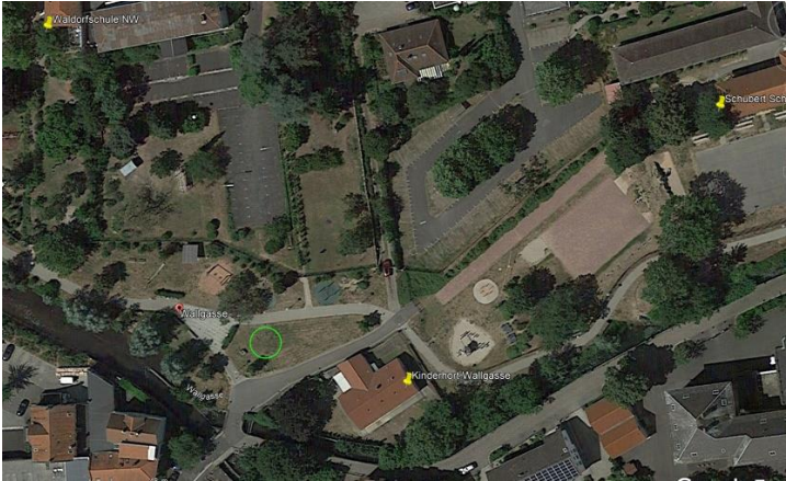
Wallgasse in direkter Nachbarschaft zu Kinderhort, Waldorfschule und Schubert-Schule